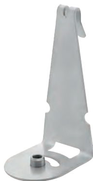
Standard Duty Support de montage pour grille de protection