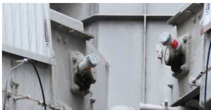
Lubrificazione di cuscinetti volventi su nastri trasportatori