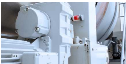
Lubrificazione del cuscinetto Tamburo parallelo