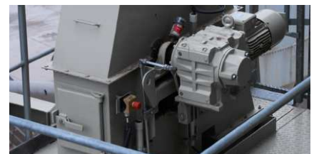
Lubrificazione dei cuscinetti volventi dell'elevatore di riempimento