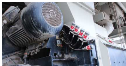
Lubrificazione delle piattaforme per miscelatori e albero per miscelatori