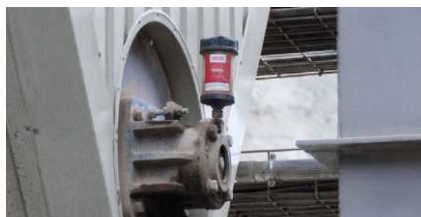
Lubrificazione di un supporto su coclea a trogolo depolverizzazione